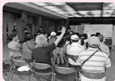
③グループを作り、場所を振り分ける (グルーピング・マッチング)