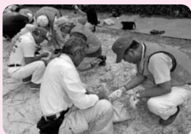
⑥土嚢作り等の活動を行う (災害救援ボランティアやませみさんの指導)