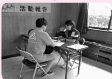
⑦資材を返却し、活動の報告をする