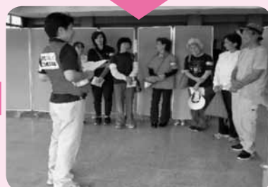
④グループごとにリーダーを決める