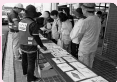
⑤資材の貸し出し(絵カード使用)