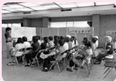
②オリエンテーション(説明)