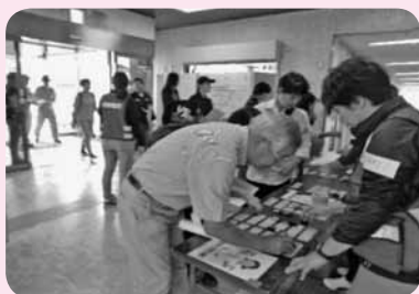
①ボランティア受付

(参加者 ボランティア93名・職員60名/会場 人吉市総合福祉センター・人吉城跡ふるさと歴史の広場)