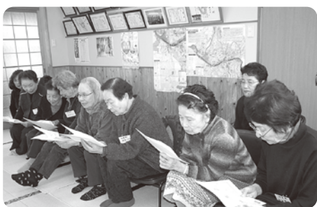
測定結果を真剣に見つめる皆さん