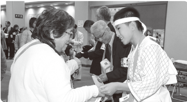
募金ありがとうございます。

んをはじめ出演団体、後援団体等のご協力で午前、午後あわせ2656枚が売上げられました。この収益は主に生活困窮世帯や高齢の方々等へ見舞金品として役立てられます。 また、前回プログラムの紙面を工夫してほしいとのご意見をいただき少しでもみやすいように午前、午後一面にしてみました。よりよい演芸会になりますようにこれからもよろしくお願ひします。