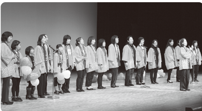
人吉総合病院コーラス部 母への愛を歌いました