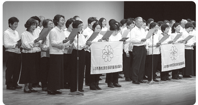
民生委員児童委員による合唱