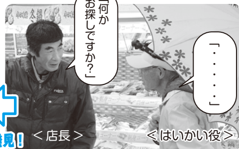
コンビニでも優しく対応していただきました