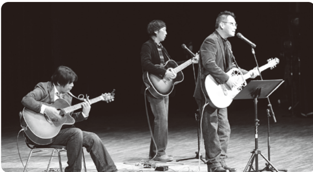
おとめや イスミ商事 音明屋 、による バンド演奏