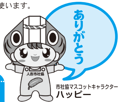
市社協マスコットキャラクター ハッピー

今回集まりました募金は、全額を県共同募金会へ送金し、その金額の約7割が来年度の人吉市の福祉活動の資金として配分されます。この配分金は、来年度のボランティア教育や、各福祉団体への助成金、福祉イベント開催、社協だよりの作成等に使います。