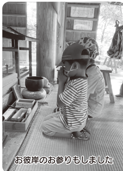
お彼岸のお参りもしました