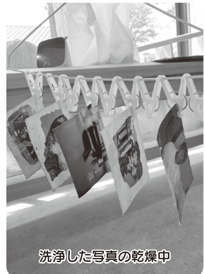
洗浄した写真の乾燥中