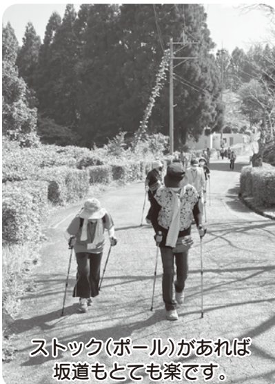
ストック(ポール)があれば 坂道もとても楽です。

*ノルディックウォーク…2本のストックを使用した歩行運動。転倒予防や効果的な全身運動ができる。