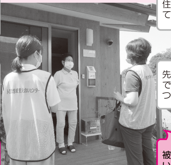
※写真は訪問活動のイメージです。