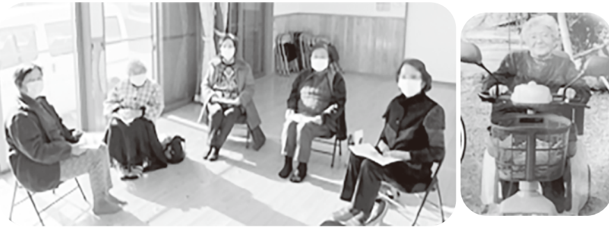
場合によっては中止会場がありますので、新たに参加される方はお問合せください。

本当に人の出会いは大事だと思っております。私も3月には百歳になりますが、体調が続く限り参加して楽しみたいと思っております。