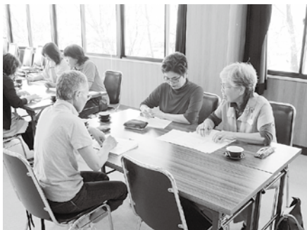
フォローアップ研修会

安全な預かりのために心がけることや緊急時の対応の仕方、またヒヤリとしたり、ハツとする事例をもとに事故を想定しながら対処法・原因・防止策についてみんなで考え話し合いました。