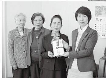
人吉市老人クラブ 連合会女性部