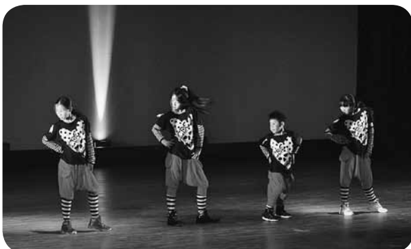
子どもたちも盛り上げました