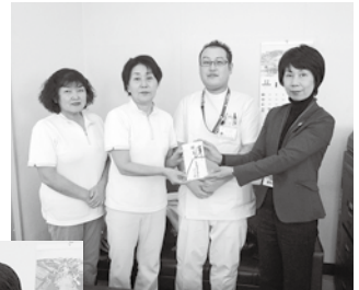
人吉総合病院エイド部

「社会福祉のために」、と温かい善意が寄せられます。社会福祉協議会では、この浄財を必要とされるところに、大切に活用させていただきます。ありがとうございました。