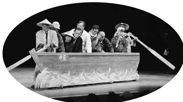
初出演の中原びっくりしゃっくり