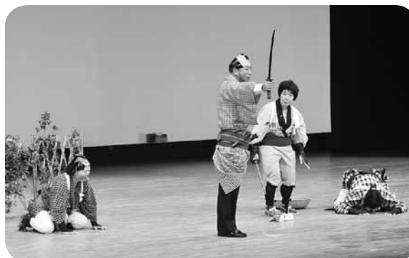
会長も一役をになって

良かった点は継続し、反省点は検討を重ねて、より親しみやすい演芸会となりますように、皆さまと一緒に創り上げていきたいと思えます。 チケット販売は町内会長さんをはじめ出演団体・後援団体等のご協力で午前・午後合わせて2592枚が売り上げられ、入場者は午前の部が949人、午後の部が936人でした。 この収益は主に生活困窮世帯や高齢の方々などへの見舞い金品として役立てられます。多くの団体に出演していただき、日頃の練習の成果が一杯発表され、舞台も会場も