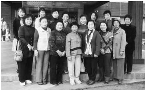
参加したメンバー