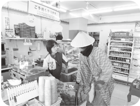
目線を合わせてやさしく声かけをしていただきました。