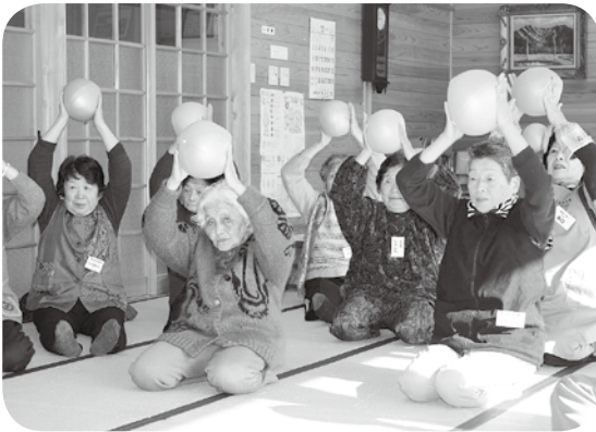
ガンバルーン体操の様子