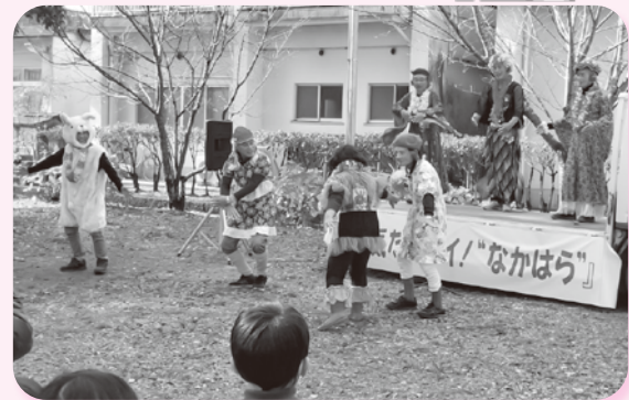
令和2年11月29日の「第一回元気だすバイ！なかはら」