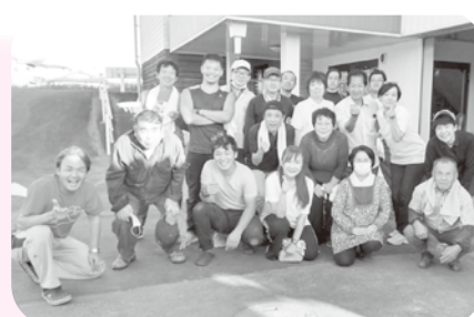
くまもと友救の会