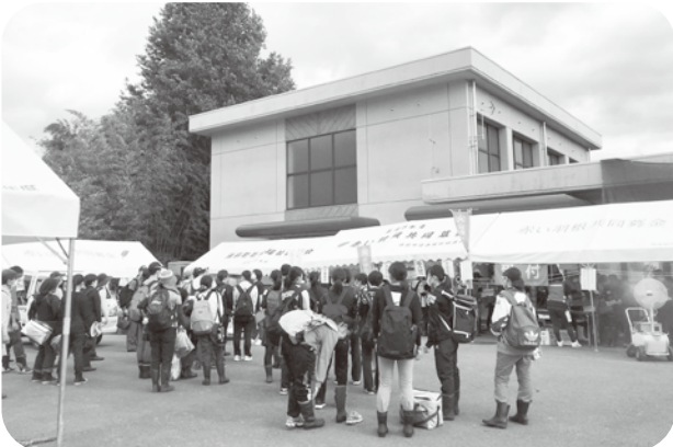
ボランティアセンターに集まった方々