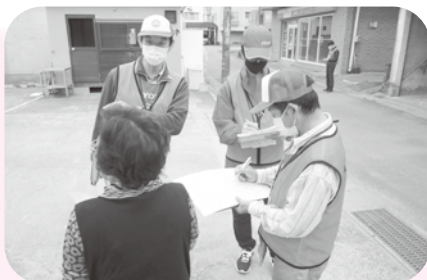
トヨタ、デンソーグループ