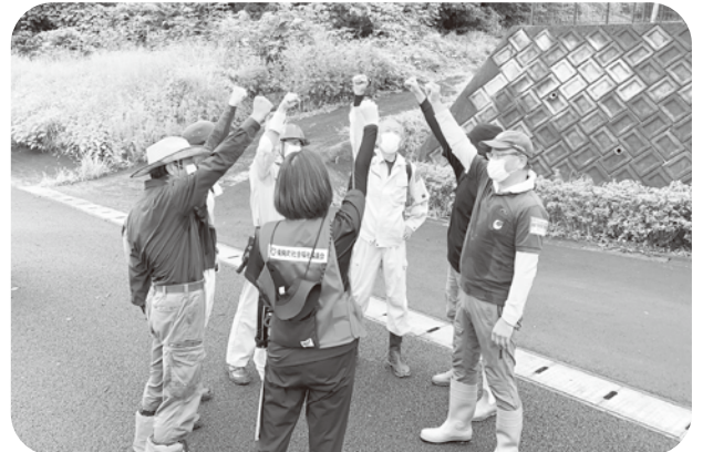
ボランティア活動頑張ろう！