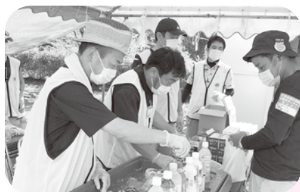
ライオンズクラブ