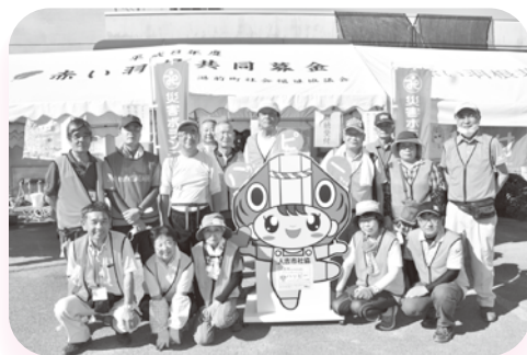
人吉市災害救援ボランティアやませみ