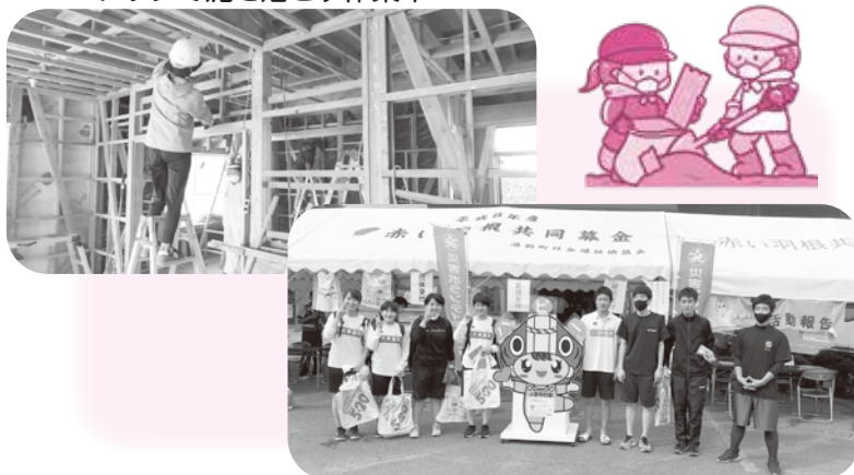
高校生や大学生の方も活躍