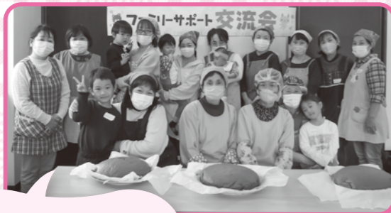
美味しい「田舎ふくれ」 ができあがりました♪

コロナ禍もあり3年ぶりの交流会となりましたが、出来上がった蒸しパンを食べながら子育ての悩みや生活のアイデアなど、和気あいあいとお話するなど有意義な時間を過ごすことができました。