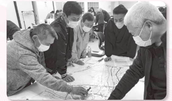
地図に危険な区域等を書き込む参加者