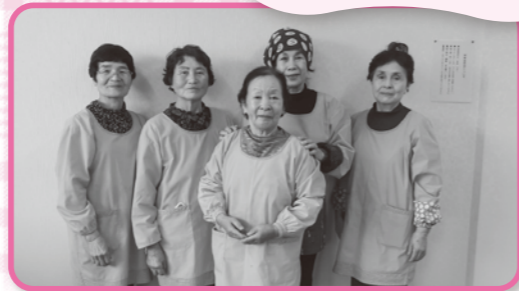
JAくま女性部 「米粉パン工房こめっ子」の皆様、 ありがとうございました