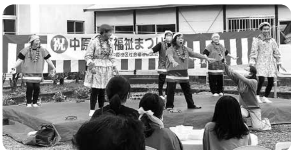
令和4年度のなかはら福祉まつりの写真です

「地域の支え合いは、命の守り綱！」が合言葉です。話を弾ませ、楽しい時間を過ごしましょう。皆さん誘い合って、お気軽にお越しください。