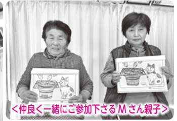
<仲良と一緒に参加下さるMさん親子>