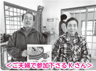
<ご夫婦で参加下さるKさん>