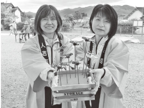
人吉市社会福祉協議会で取り扱っています。