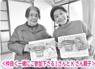
<仲良と一緒に参加下さるIさんとKさん親子>