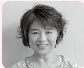
生活支援コーディネーター