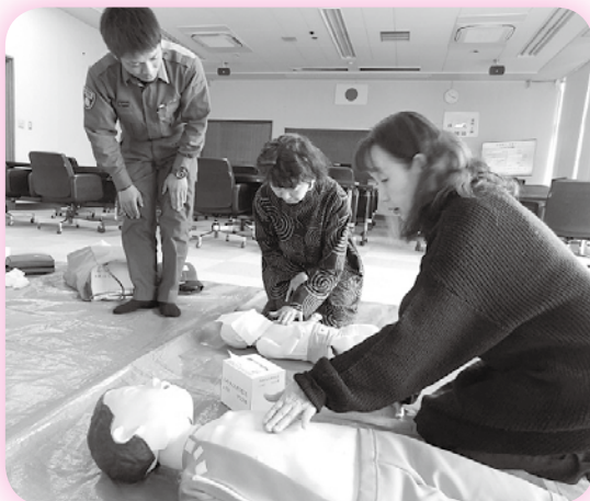
ファミリーサポート協会会員養成講座 (普通救命講習)の様子