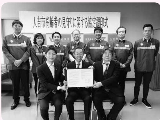
平成31年3月25日 協定調印式の様子

人吉市社会福祉協議会と人吉市は、コンビニエンスストア(株)セブン-イレブン・ジャパンと、高齢者の見守りに関する協定を結びました。