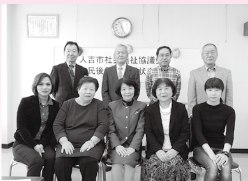
市民後見人委嘱状交付式