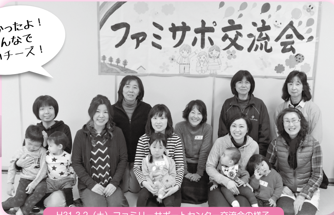
H31.3.2 (土) ファミリーサポートセンター交流会の様子