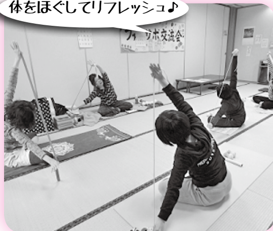
「やさしいヨガとセルフケア」自分で 体をほぐす方法を体験しました