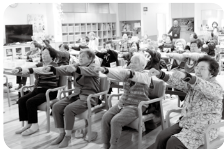
体を伸ばして・・・ 気持ちよか～

瓦屋町のミニサロンは、万江病院デイケアセンターを会場に、3月24日に開催されました。今回は、人吉ころばん体操を体験してみよう！ということで、対象者と援助者40人で気持ち良く体を動かしました。