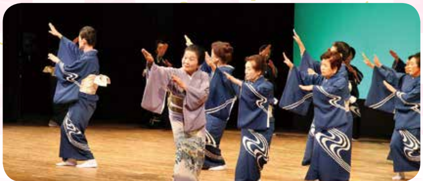
日舞協会・日舞協会OB有志による球磨川新調