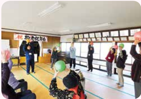
ガンバルーンボールで体操中

これから、日常生活の困りごとについてのアンケート調査を、デイサロン会場や戸別訪問で実施する予定です。ご協力よろしく願いいたします。