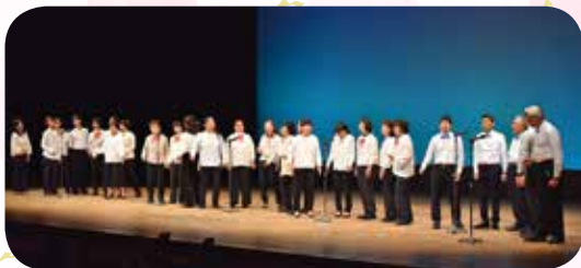
社協職員も50回記念で出演しました