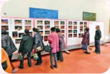
50回を振り返る展示コーナー