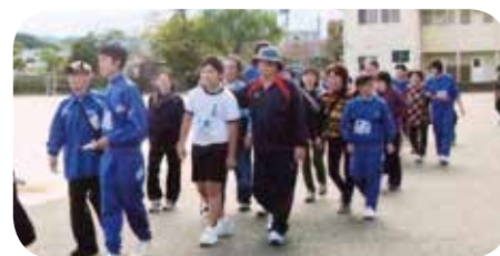
一中生も参加したウォーキング大会の様子