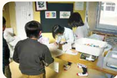
ペットボトルキャップ回収の様子

普段ごみになってしまいそうなものが、困っている人たちの役に立つものに変えられるということ、一人一人のちょっとした心がけが、大きな力になるということを実感しながら頑張っています。(人吉西小)