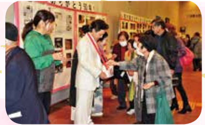
共同募金活動も行いました