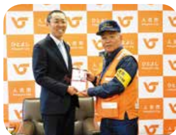
人吉市鳥獣被害対策実施隊様