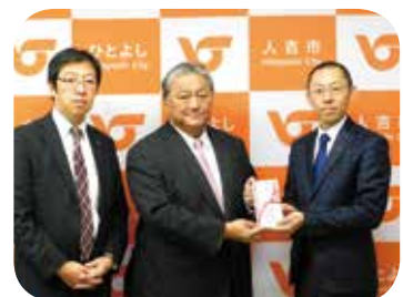
熊本中央信用金庫 人吉支店信交会様