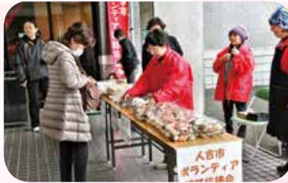
ボラ連によるバザー販売