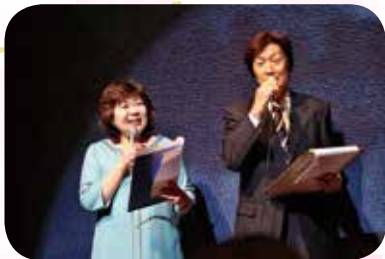
息ぴったりの司会

ご来場の皆様、ご出演の皆様、チケット販売にご協力いただいた皆様、誠にありがとうございました。