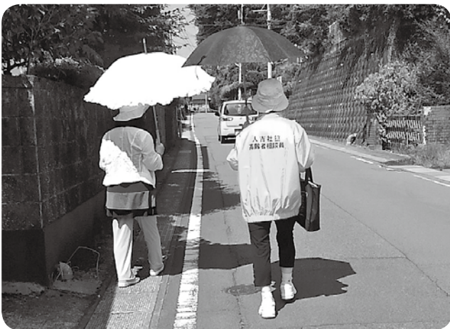
アップダウンのある道も徒歩で

取材した日は8月初めで、日差しも強く、暑さも厳しい日でした。そんな気候の中でも笑顔を絶やさないお二人の明るい声かけに、皆さんのお顔も笑顔でいっぱいでした。