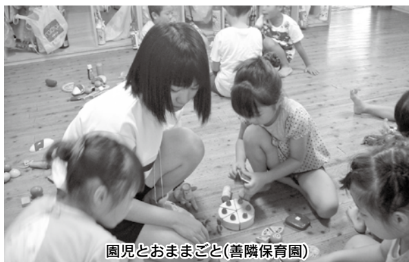
園児とおまごど(善隣保育園)