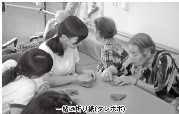
一緒に折り紙(タンポポ)