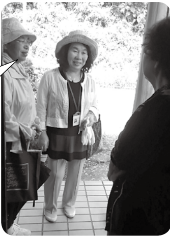
お変わりありませんか？