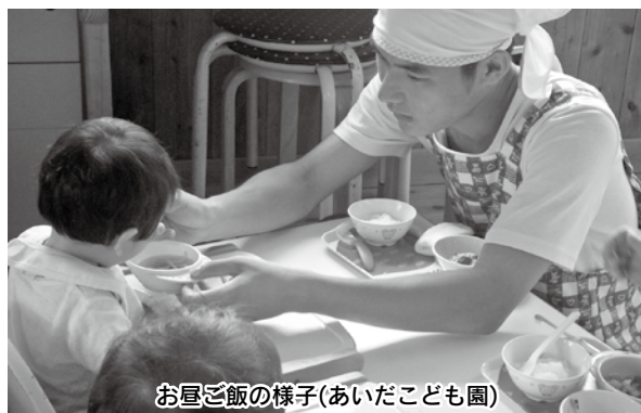
お昼ご飯の様子(あいだこども園)