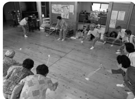
童心にかえってコマ回し「それっ!!」