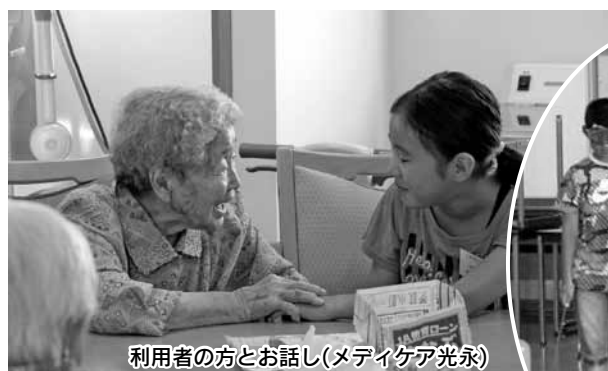
利用者の方とお話し(メディケア光永)

児童福祉部会員・民生委員児童委員の皆様もスタッフとして、児童たちに寄り添っておられました。