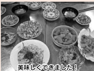
美味しくできました！