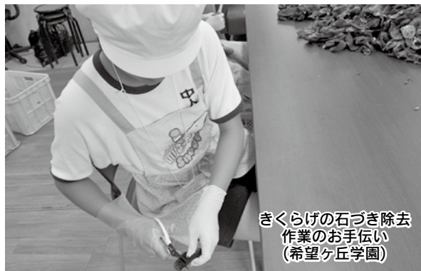
きくらの石づき除去 作業のお手伝い (希望ヶ丘学園)