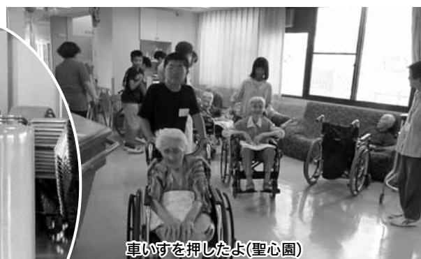
車いすを押したよ(聖心園)