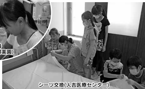
シーツ交換(人吉医療センター)