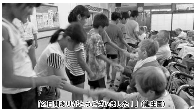
『2日間ありがとうございました!』(龍生園)