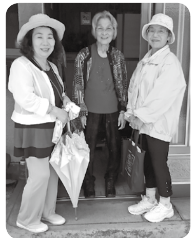
笑顔を見ると安心です

A グラウンドゴルフなど自分の好きなことをすることですね。給食ボランティア活動もしていますが、活動的に動くことが元気の秘訣だと思います。