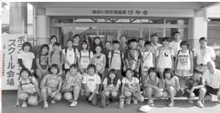
最後に記念写真(ボランティアスクール 会場：けやき)