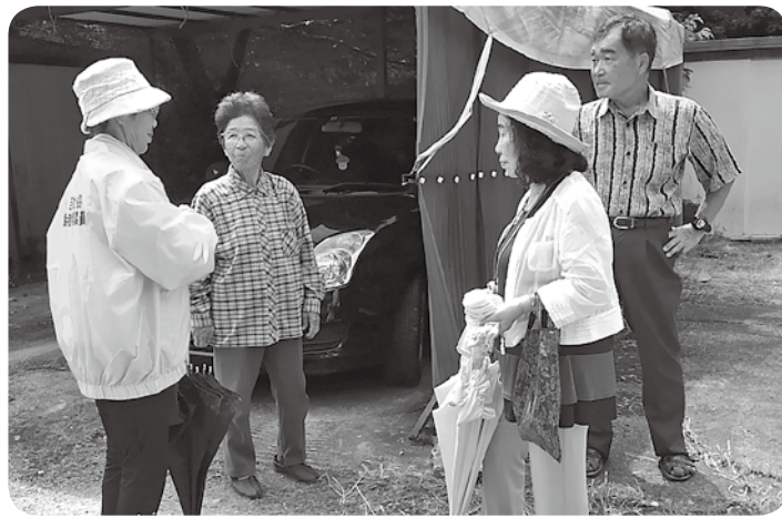
竹田町内会長も立ち寄り、談笑中