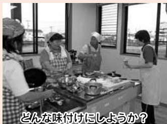
どんな味付けにしようか？