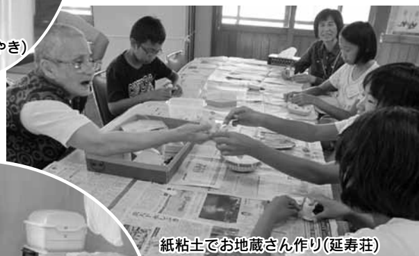
紙粘土でお地藏さん作り(延寿荘)