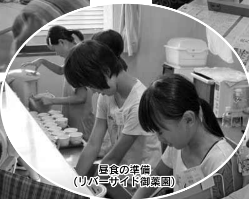
昼食の準備 (リバーサイド御薬園)