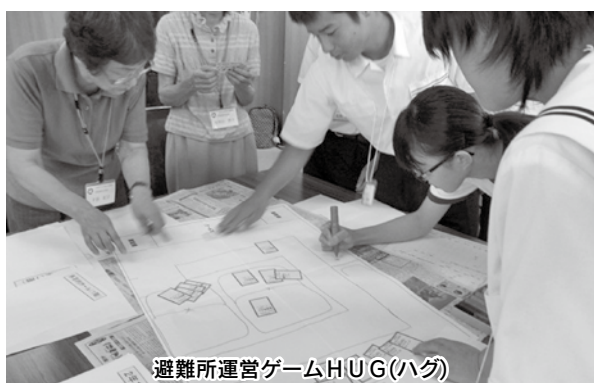
避難所運営ゲームHUG(ハグ)