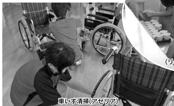
車いす清掃(アゼリア)