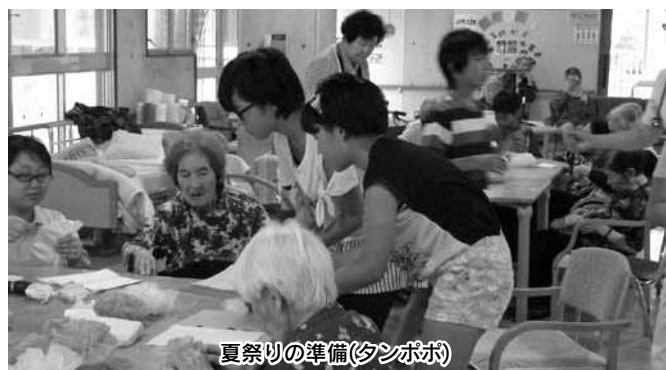
夏祭りの準備(タンポポ)