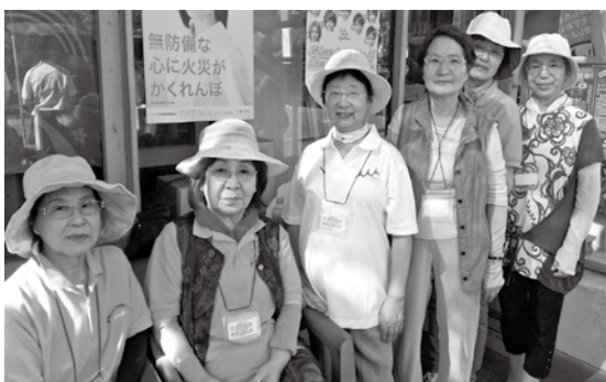
24時間テレビの募金に参加