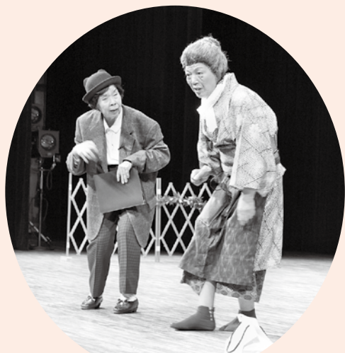
歳末たすけあい演芸会でのコント

でもその気になれば日常生活の中にお笑いのネタはいっぱいあるものです。今では、チンドン・漫才・コント・バナナの叩き売り・腹話術・大道芸など何でもござれ広く浅くやっております。