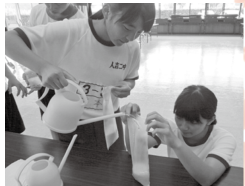
お米おいしく炊けるかな？ (災害ボランティアコースでの炊き出しの様子)