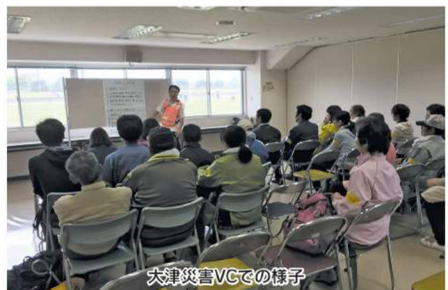
大津災害VCでの様子