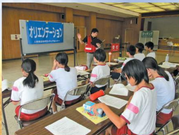
災害ボランティアコース (災害ボランティアセンターの流れを説明)