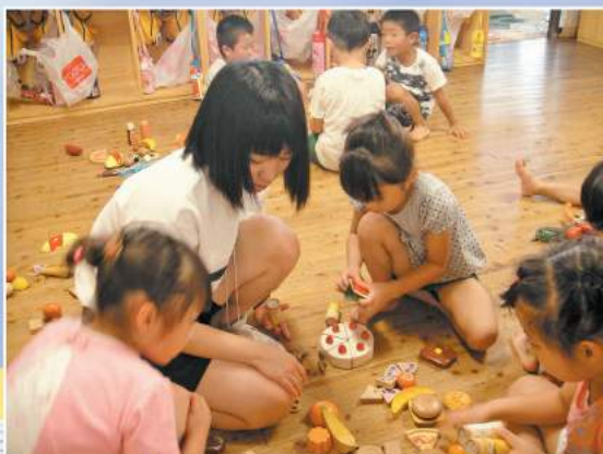
ボランティア体験教室