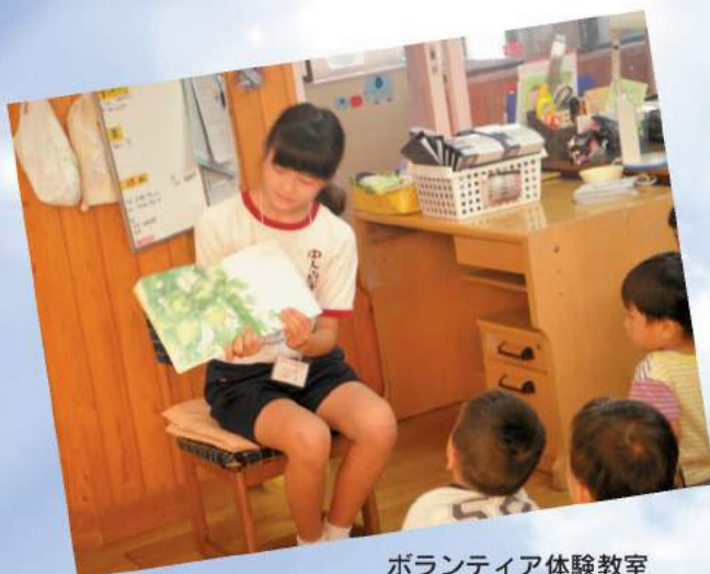
ボランティア体験教室 (絵本の読みきかせ)