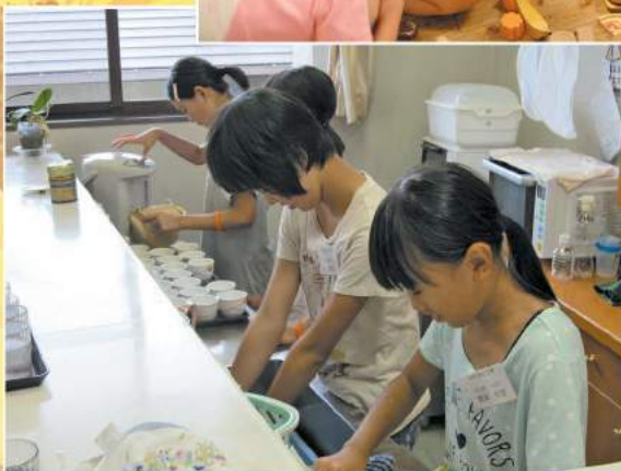
ボランティアスクール