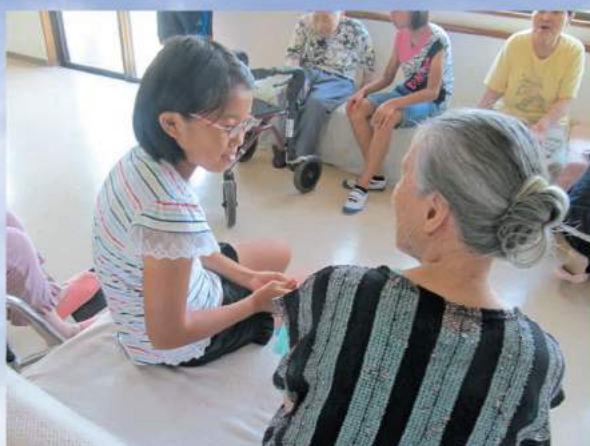
ボランティアスクール (利用者との交流)

本年度も市内の多くの福祉施設・保育園・病院にご協力いただきます。多くの小中高校生の参加をお待ちしています!