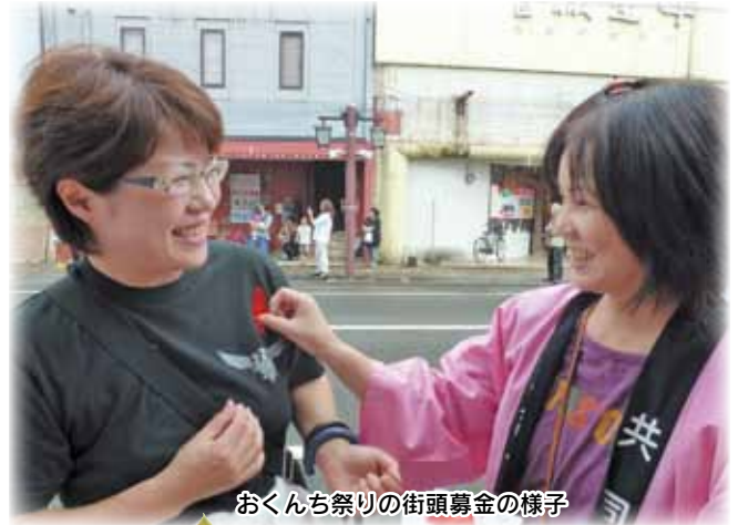
おくんち祭りの街頭募金の様子

11月12日(土)・13(日)人吉産業祭でも募金活動を行います。PRテントにぜひお立ち寄りください。