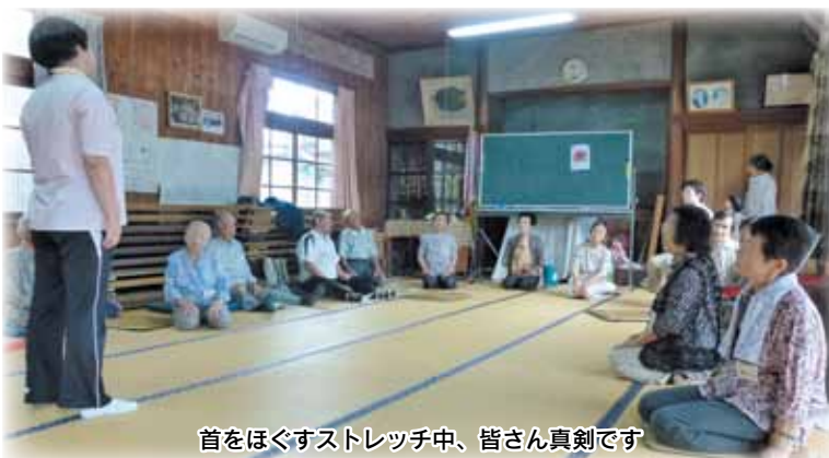
首をほくすストレッチ中、皆さん真剣です