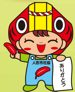
人吉社協キャラクター「ハッピー」

チケットは1枚1,000円です。 チケットの購入は、お住まいの地域の町内会長か、 出演団体、後援団体、イスマ本店(～12/3まで) 人吉市社会福祉協議会にてお求め下さい。(☎0966-24-9192) (※チケットの払い戻しはいたしません。)