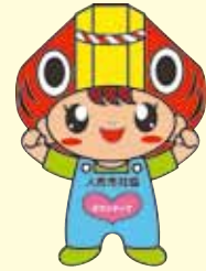
※熊本県ボランティアセンター発行 ボランティアハンドブックより