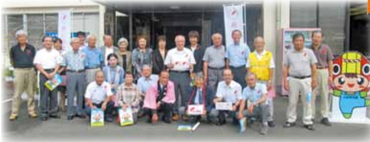
出発式(各種団体の皆様)