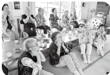
昼食前の嚙下体操

を続けることで、昨年よりも筋力がアップした方や、現状を維持し続けている方が多くいらっしゃいます。