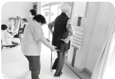
片足を上げて筋力を測ります