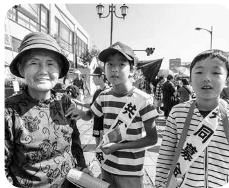
おくんち祭での募金活動

10月1日から共同募金運動がスタートしました。10月9日のおくんち祭に合わせて、市内小中学校をはじめ様々な団体からボランティアとして参加していただき、募金活動を行いました。ご協力いただきました皆様ありがとうございました。共同募金運動は12月31日まで行います。