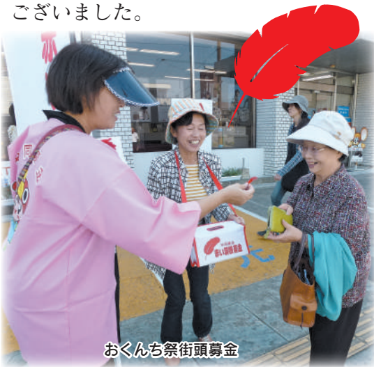
おくんち祭街頭募金