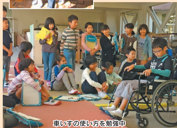
車いすの使い方を勉強中