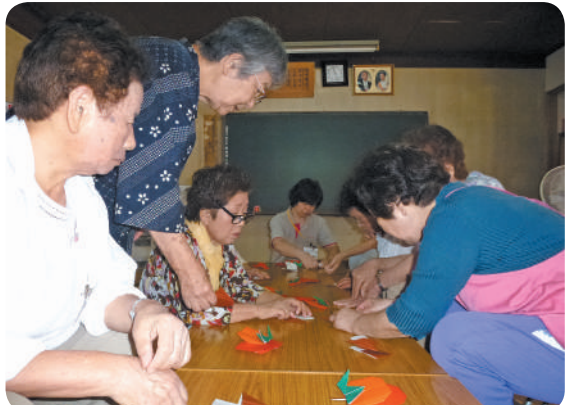
「この折り方で合ってる?」「こぎゃんすつとよ」