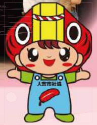
人吉社協キャラクター「ハッピー」