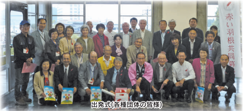
出発式(各種団体の皆様)

10月9日には、おくんち祭街頭募金を行いました。募金活動にご協力をいただいた皆様、誠にありがとうございました。