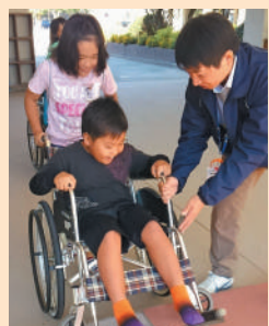
段差をうまく超えられるかな？