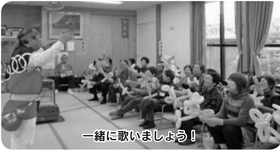
一緒に歌いましょう!