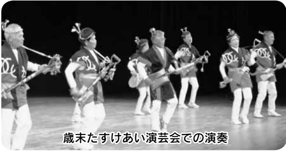
歳末たすけあい演芸会での演奏