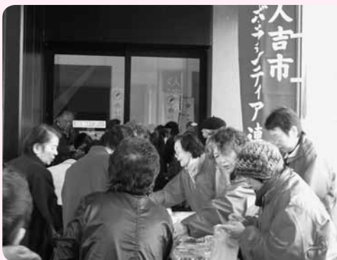
歳末たすけあい演芸会でバザーの様子