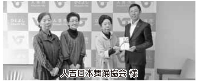
人吉日本舞踊協会 様

第1回チャリティーショーの益金の一部を寄付していただきました。大切にに使わせて頂きます。