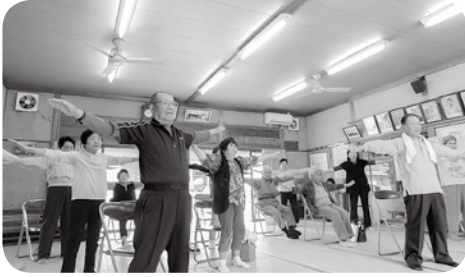
自分のペースに合わせて体操