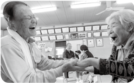
「あら～間違えた～」 脳トレで笑顔に

今回は、鶴田町会館の「あさデイ」におじゃましました。これまで鶴田町では、デイサロンのみの開催でしたが、町内からの熱い要望をいただいて4月から「あさデイ」も始まりました。この日は13名の参加があり、体操のひとつひとつを姿勢や呼吸を意識しながら行いました。脳トレでは、「こいのぼり」を歌いながら手遊びをし大変にぎわい、初めて参