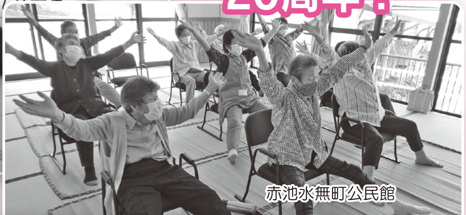
赤池水無町公民館