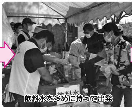
飲料水を多めに持って出発