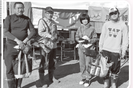
福島県南相馬市の皆さんからのメッセージ