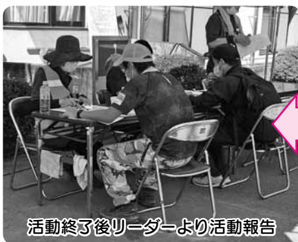
活動終了後リーダーより活動報告