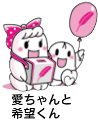
愛ちゃんと希望くん

市民の皆様には、心をつなぐ共同募金の意識を改めてご理解いただき、それぞれできる範囲でのご協力をお願い致します。結びに、災害からの早期復旧・復興と住民福祉の更なる向上、市民の皆様方のご健勝、ご多幸をご祈念申し上げます。