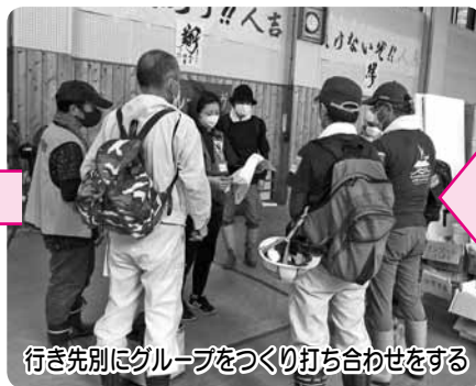
行き先別にグループをつくり打ち合わせをする